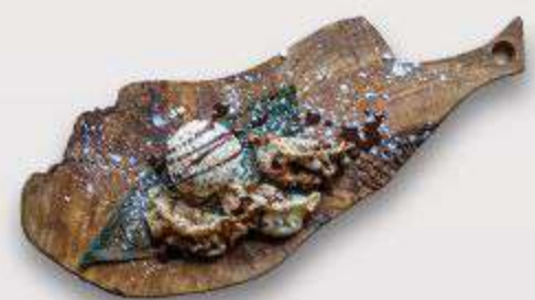
Gyoza Apple Pie