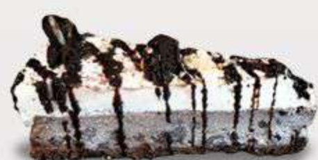
Tarta de Oreo