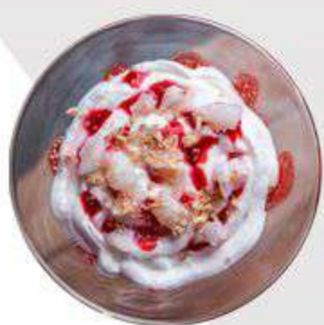
Sweet Cheese Ending